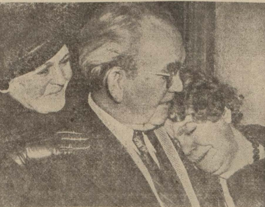
Bir masumun beraeti: Bu Amerikalı uzun müddet ağır bir itham altında hapisanede kaldıktan sonra masumiyeti tebeyün ederek kurtulmuştur. Bir tarafında karısı, öte tarafında hemşiresi oğdan büyük bir heyecanla bu beraeti karşıyorlar.