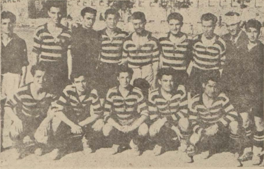
Bugün kuvvetli hasımları Galatasaray karşısında cenkleşecek olan Beykozcular

Bu mühim karşılaşma Beykozla Galatasaray arasında