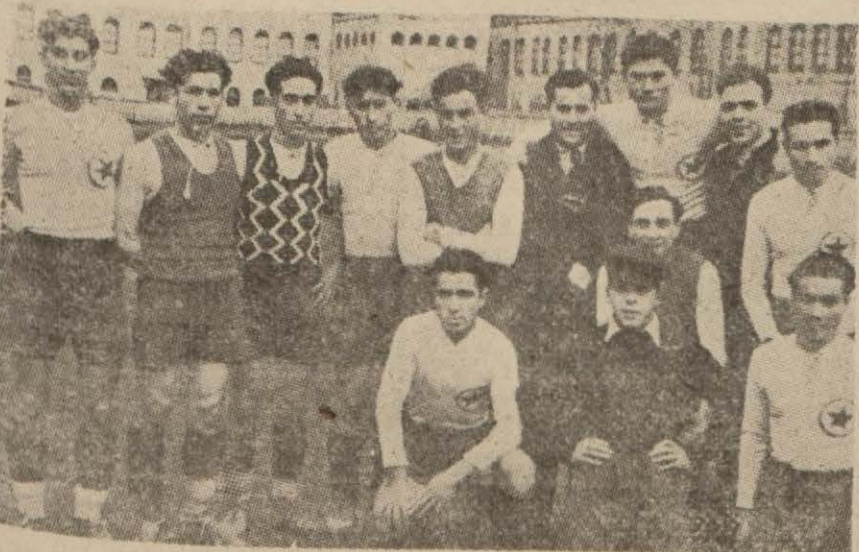
Bugün Fenerbahçe karşısında göreceğimiz Topkapılılar

Rum vatandaşlardan mürekkep Beyoğluspor yine Rum klüplerinden teşkil edilecek bir muhtelite karşı koyması oldukça enteresandır. Bu maçı hakem İzzet Apak idare edecektir.