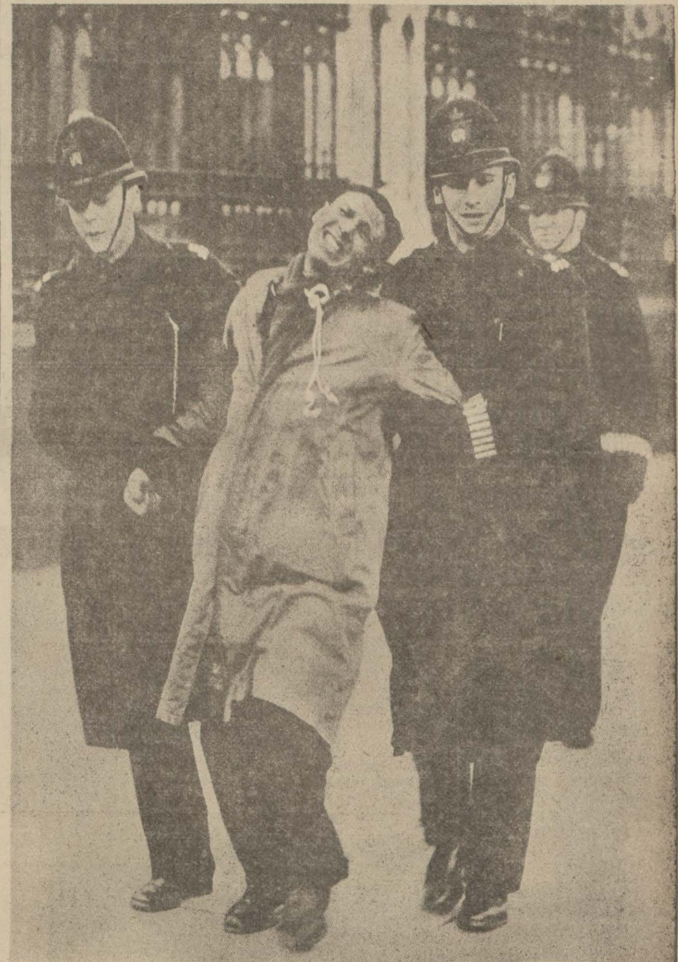
İngilteredeki suikastler münasebetiyle bir suikastçinin İngiliz polisi tarafından tevkifi