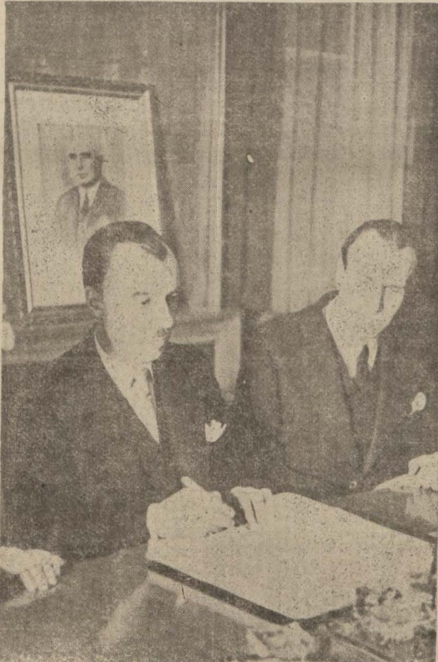
Yukarıda sağda: İmza merasiminde iki taraf murahhasları bir arada, yukarıda başta: Nafia Vekilimiz İtilâfi imzalararken, aşağıda: İtilâfi şirket murahhası SPESYAL imzalararken